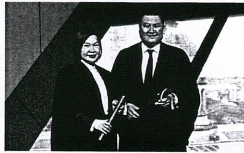
Trang phục Luật sư Singapore