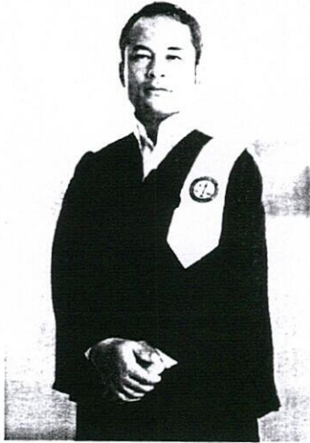
Trang phục Luật sư Lào