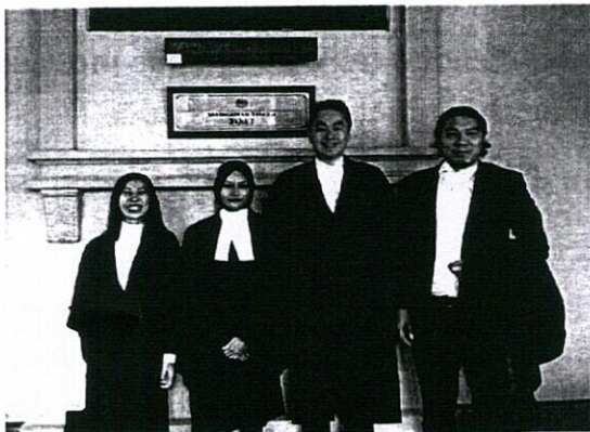
Trang phục Luật sư Malaysia

Trung Quốc là ví dụ tiêu biểu ở châu Á vừa tiếp thu mô hình áo choàng của hệ thống luật hiện đại, vừa điều chỉnh cho phù hợp với bối cảnh văn hóa và pháp lý trong nước.