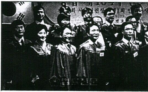
Trang phục Luật sư Hàn Quốc