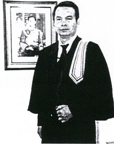
Trang phục Luật sư Thái Lan