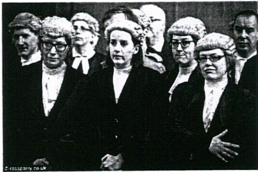
Trang phục phiên tòa của Luật sư Anh