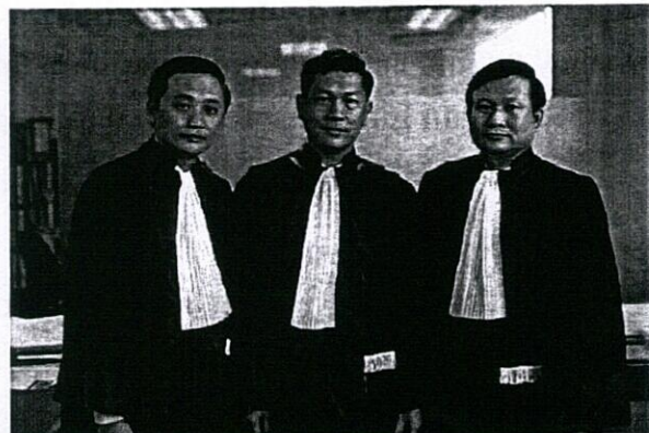
Trang phục Luật sư Campuchia